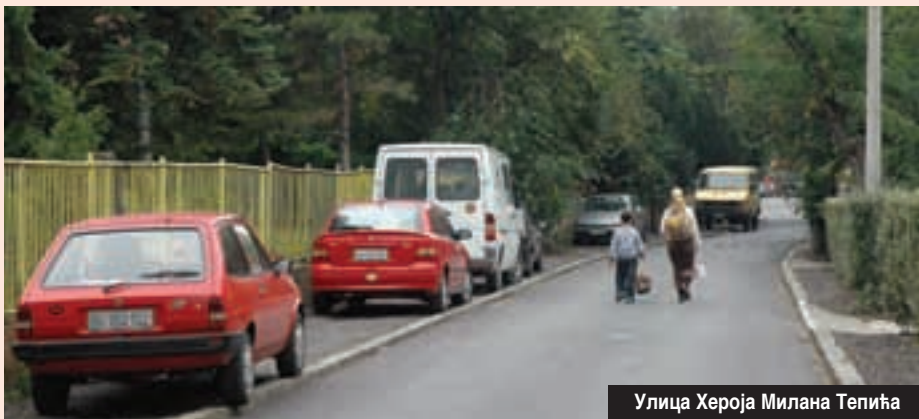
Улица Хероја Милана Тепића