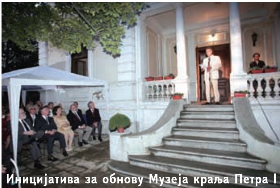
Иницијатива за обнову Музеја краља Петра I