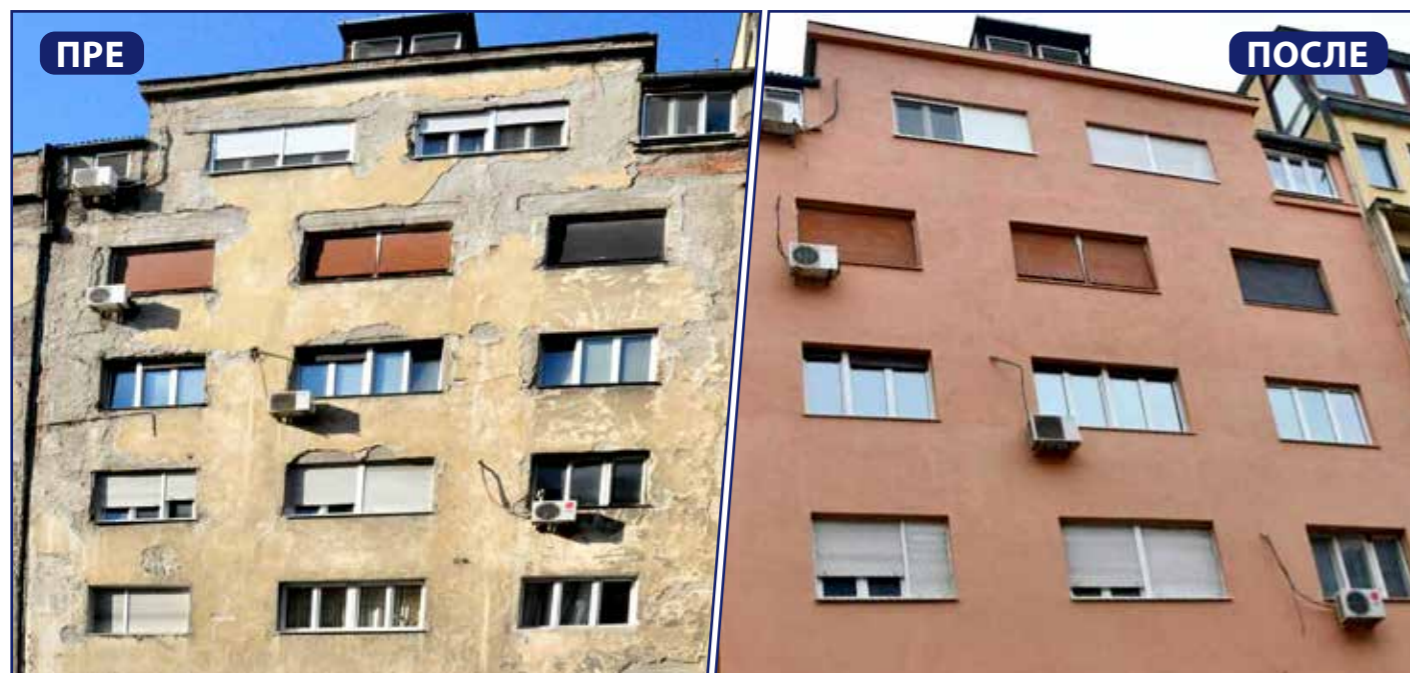
Гаврила Принципа 24

Општина Савски венац и убудуће ће подржавати иницијативе грађана, а посебна пажња биће посвећена реализацији оваквих активности, које подижу квалитет живота у нашој локалној заједници.