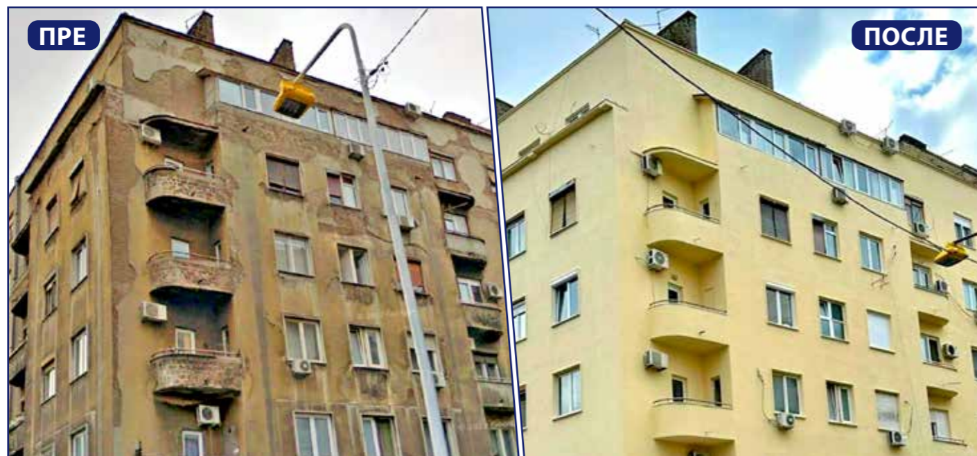
Михаила Божићевића 6

Савски венац једна је од првих општина која је суграђанима омогућила унапређење својстава зграда тако што смо директно укључени у њихово обнављање. Овај напор наших служби већ је крунисан знатно лепшим изгледом бројних здања у нашем окружењу.