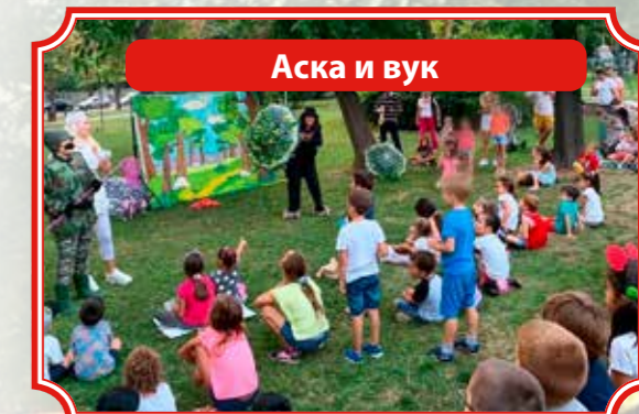
Аска и вук