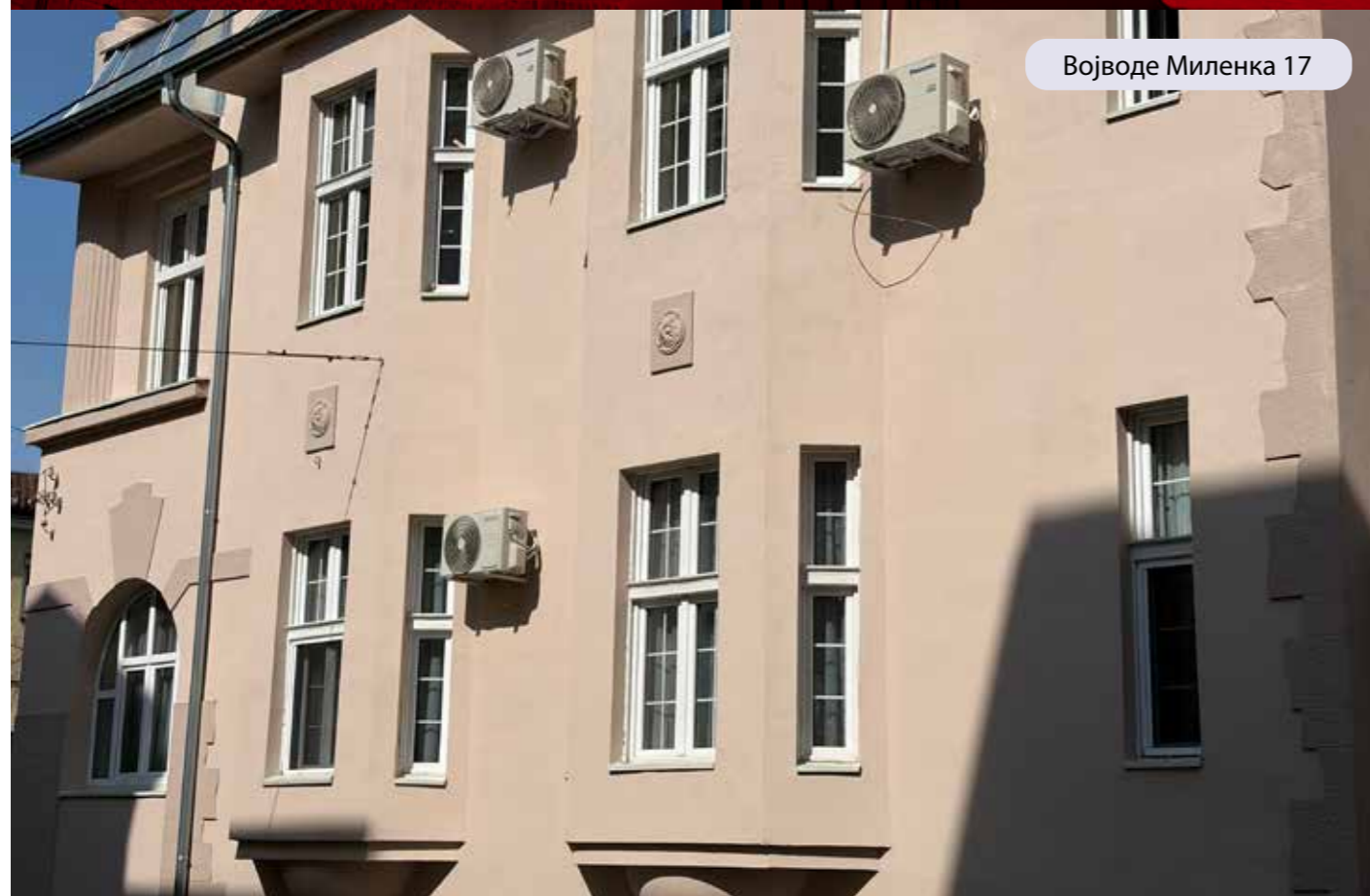
Војводе Миленка 17

Лепше рухо добиле стамбене зграде у Ресавској 65 и Војводе Миленка 17